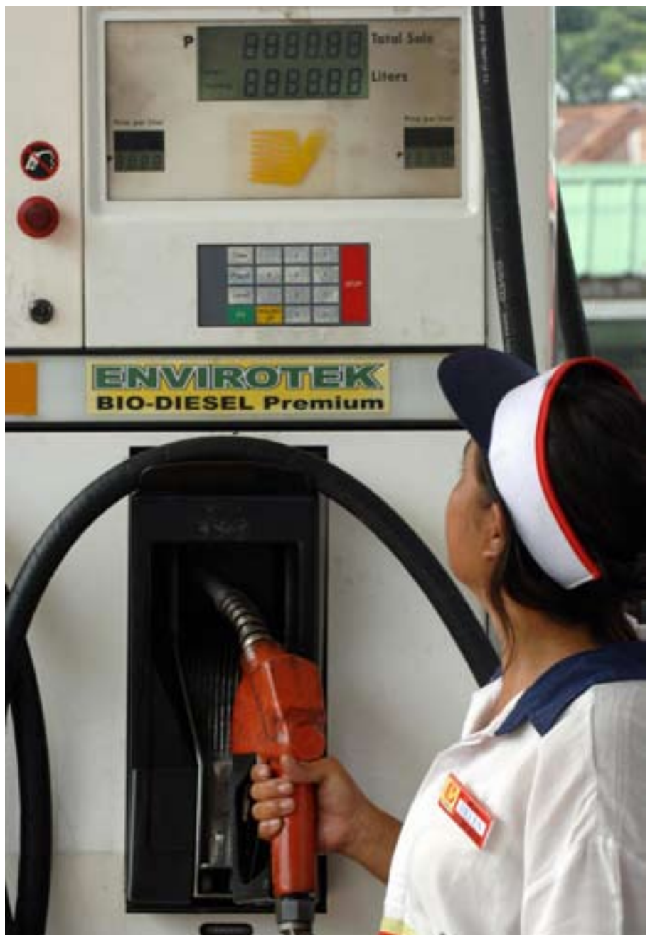
Surtidor de biodiesel en Manila, obtenido a partir de aceite de coco.

Se podría alegar que, al proponer cultivos energéticos, se está pensando en recurrir a prácticas de agricultura ecológica –o cultivos como el cardo–, menos intensivas en el uso de combustibles fósiles. Pero sería paradójico que se pusiera un empeño especial en recurrir a esta estrategia cuando se quiere dedicar la superficie agrícola a producir energía, y en cambio se le preste escasa atención y recursos cuando se trata de reconvertir ecológicamente los sistemas agrarios para mejorar sustancialmente la calidad de los alimentos y la salud de los ecosistemas.