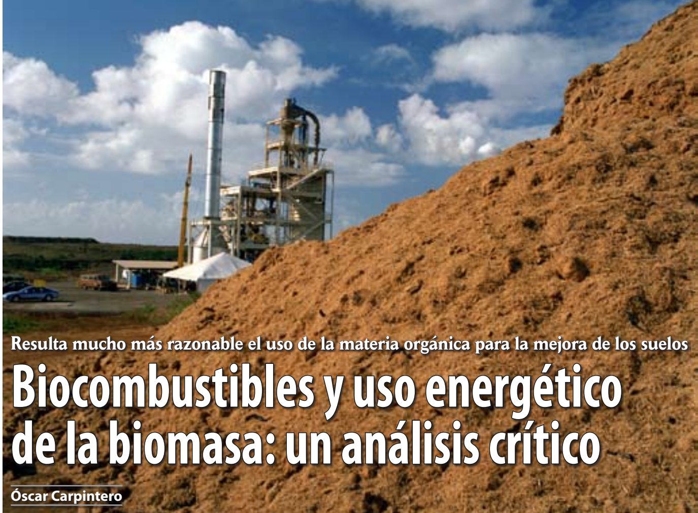
Biomasa y planta de tratamiento para la obtención de energía.

Resulta mucho más razonable el uso de la materia orgánica para la mejora de los suelos